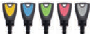
Clés d'utilisateurs en 5 couleurs