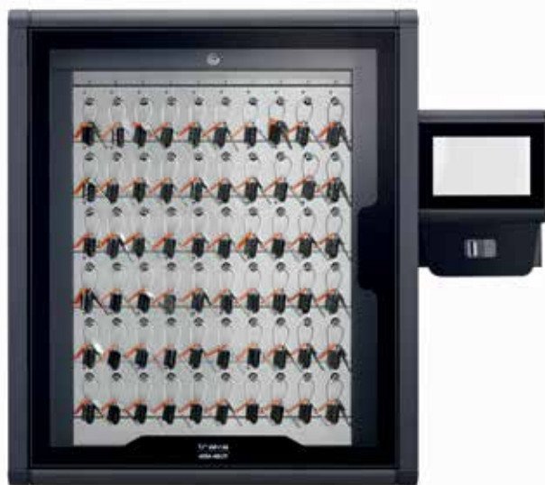
Touch Pro S (jusqu'à 480* clés)