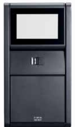
Touch Pro V (5 clés)