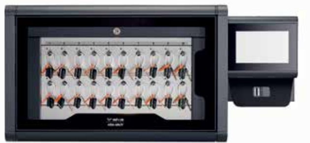
Touch Pro M (jusqu'à 40 clés)