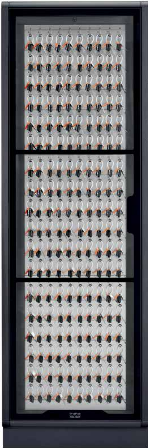
Touch Pro L (jusqu'à 720* clés)

Traka Touch Pro est notre armoire la plus sécurisée à ce jour et est disponible en quatre tailles différentes, permettant de gérer de 5 à 720 clés.